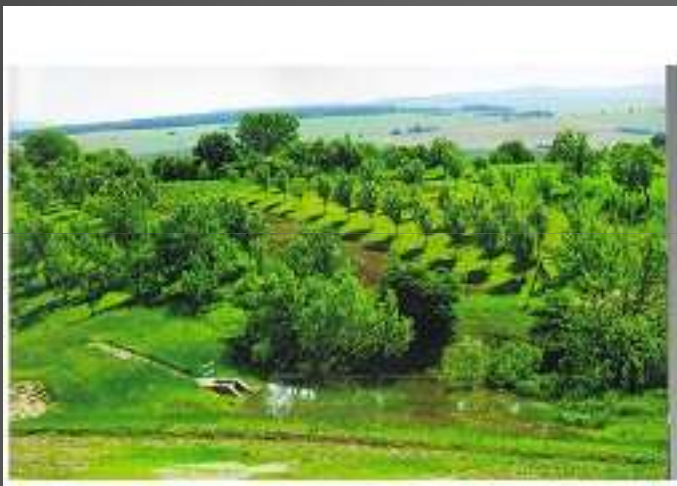
Poldr ve Slavkově

Předat našim dětem krajinu zdravou a fungující a krásnou